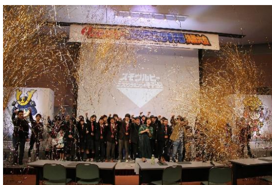
[決勝トーナメント]