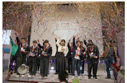
[決勝トーナメント]