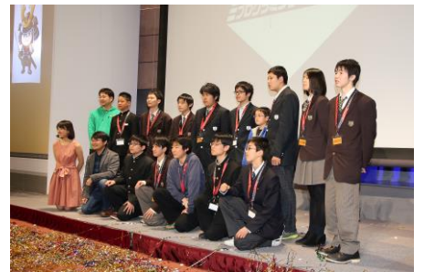
[決勝トーナメント]